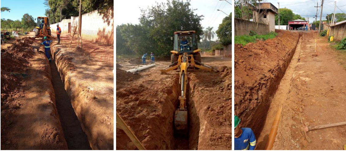
Imagens 1, 2 e 3: À esquerda e ao centro, abertura da vala e, à direita, berço de areia sobre rede implantada.

do berço de areia e fechamento e compactação do solo. Abaixo, seguem imagens durante a implantação das obras de rede de esgoto: