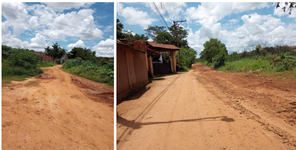
Imagens 6 e 7: Condição final da Avenida após obras realizadas, anteriormente ao período de chuvas.