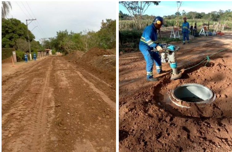
Imagens 4 e 5: Fechamento de vala e compactação do solo.